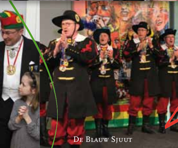
DE BLAUW SJUUT