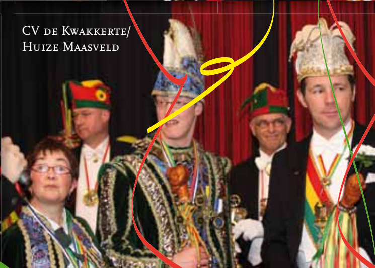
CV DE KWAKKERTE/ HUIZE MAASVELD