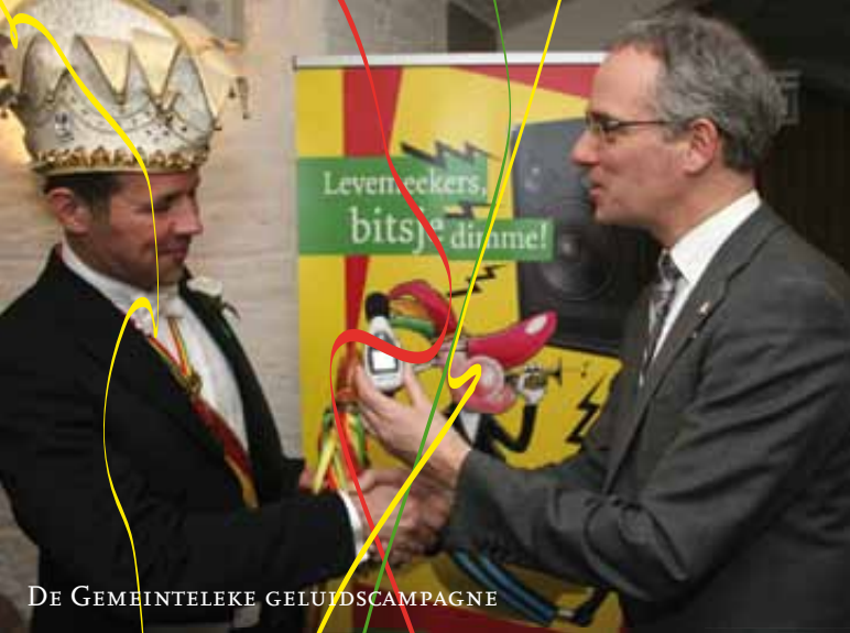
DE GEMEINTELEKE GELUIDSCAMPAGNE