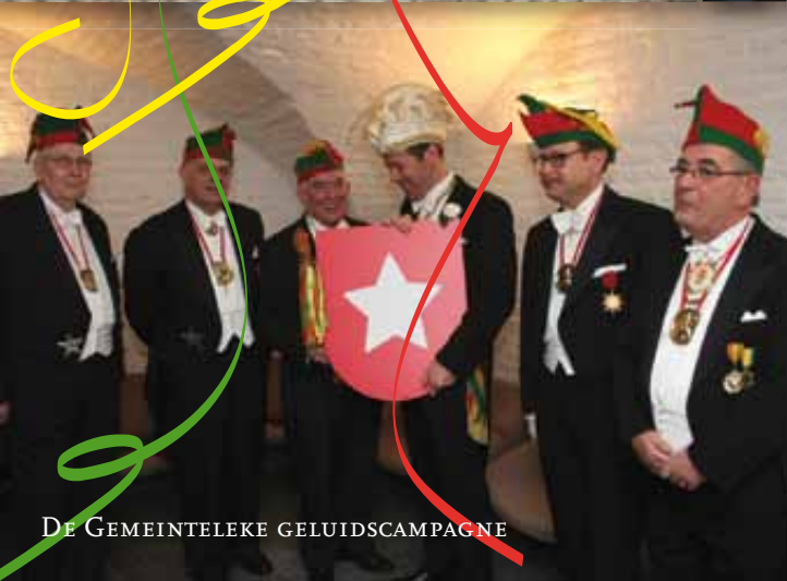
DE GEMEINTELEKE GELUIDSCAMPAGNE