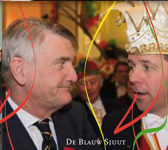
DE BLAUW SJUUT