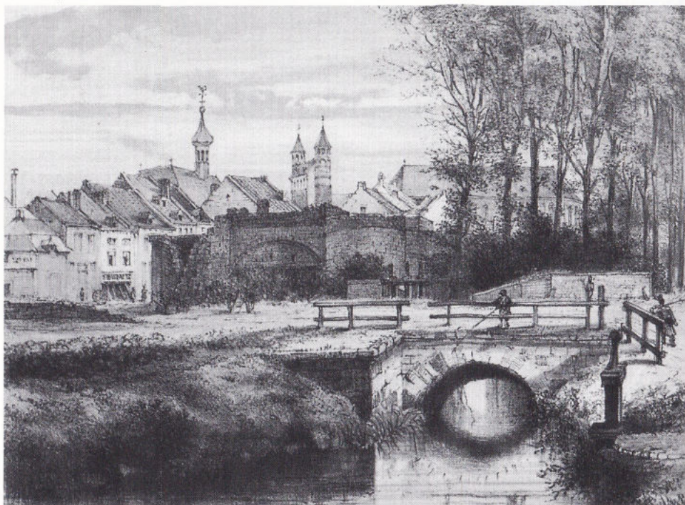
MEASTRICHT - BRECHE A LA PORTE SAINT PIERRE