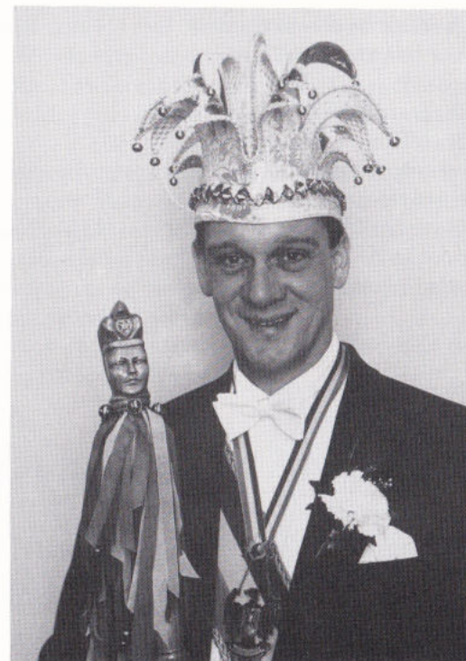
Aonneumericus - Bourgondicus - Stickaticus