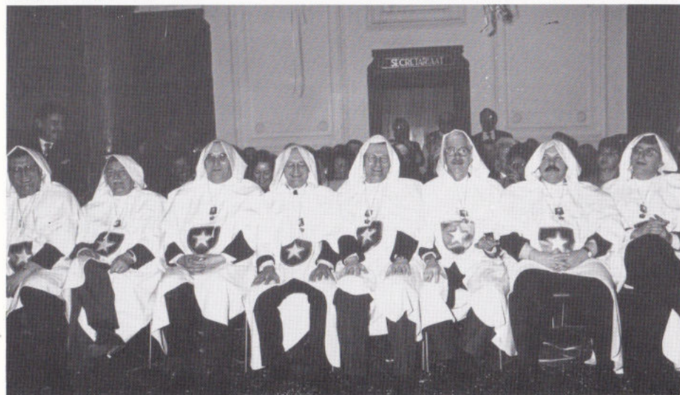
't Kollézje ge-uniformeerd. (Allemaal 't zellefde)