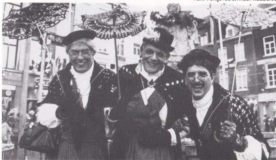
Tant Versjeeve en häör naaberse