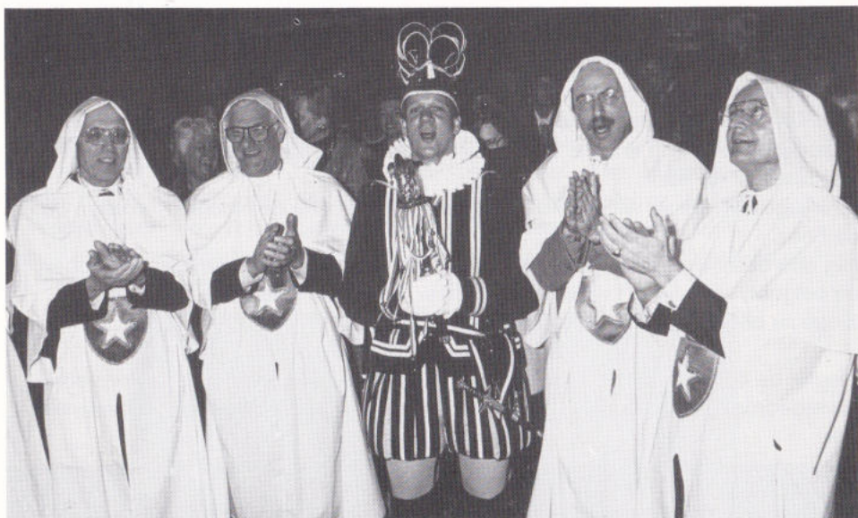
Hoeggeïerde gaste in spesjoal tenue.