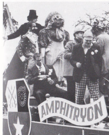
Vrouw Wielemösj mèt häör studente...

Prins en Tempeleers in de Groeten optocht