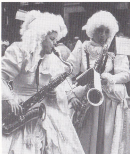
Sjoen meitskes in Mestreech en meziek.