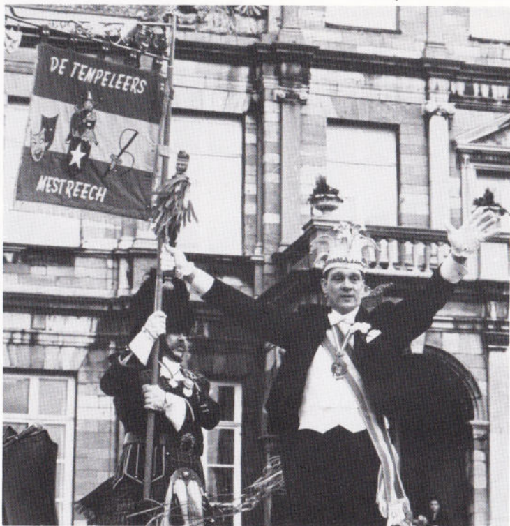
Stadsprins vaan Mestreech 1993

Nao 't démasqué óntvóng Ziene Hoeglöstigheid de prinseleke attribute: plakèt, möts en scepter. Daonao lag heer den eid aof op 't masker. In zien touwspraak reep heer 't Vollek vaan Mestreech op, häöm te hellepe um "de sjoenste stad vaan de wereld de gezèllegste vastelaovend te bezörrege".