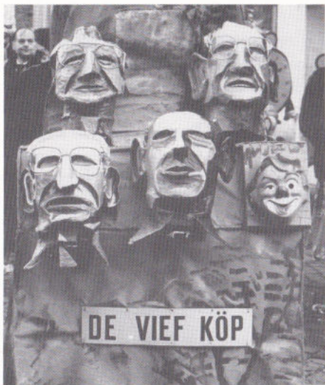
... Nikkelake ouch...