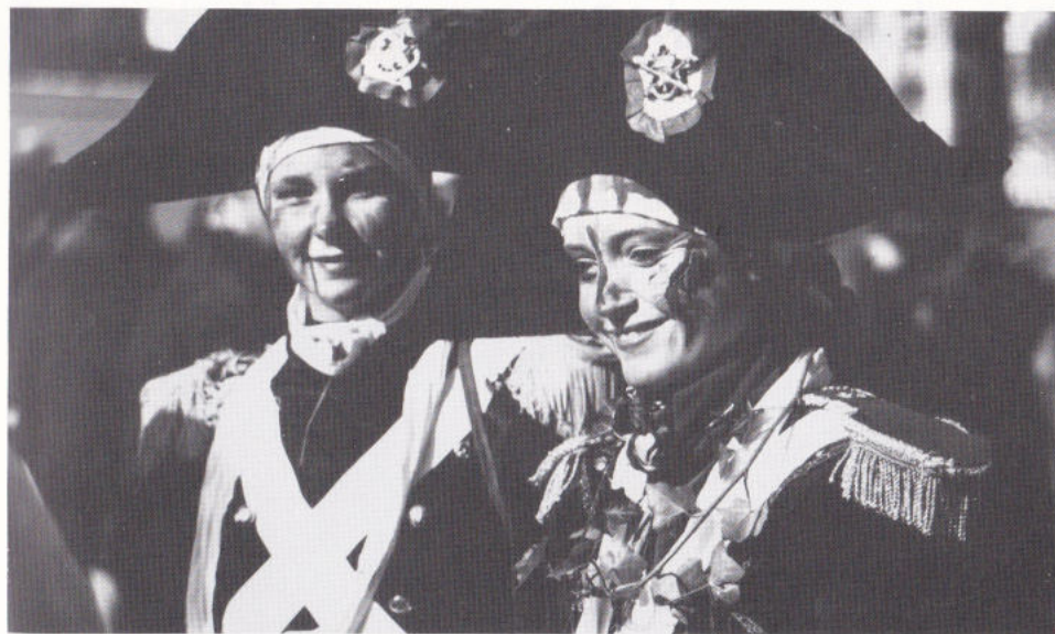
Sins Napoleon neet mie zoe sjoen.