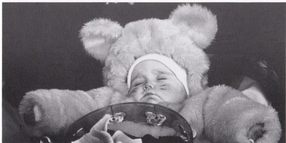
Evekes... de uigskes tow.