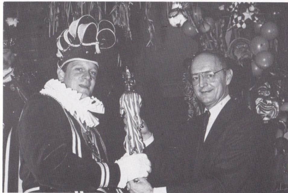
De scepter weurt euverhandig mèt de mach(!)

Naotot de Börregemeister 't simbool vaan 't gezag, de scepter, aon de Prins had euvergedrage, waor, onder 't genot vaan e drenkske, ederein 't weer mèt ederein ins.