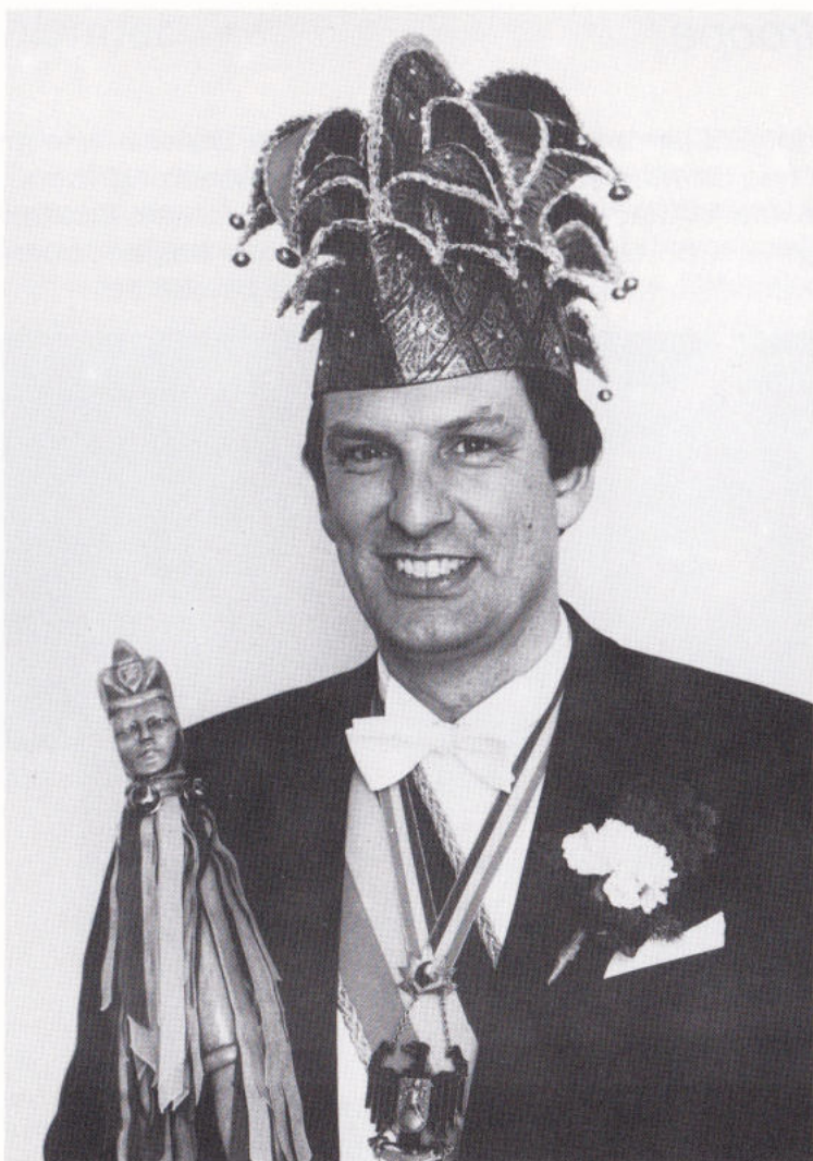
PRINS ROB I.