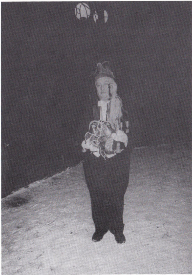
DE LESTE MENUUTE.