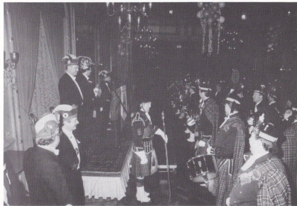
ZAOTERDAG IN DE REDÔTTE.

Umtot 't fies op 't Stadhoes dit jaor neet doorging, zien de Tempeleers, hun hoedoeve, de börregermetwerrekers en de Protektäörs dee middag gezellig bijein gewees in de Redotte. Dao is de Prins towgesproke en heet heer 'nnen alternatieve zwajeuzen entree gehad.