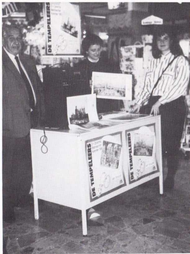
DE KELENDER WEURD GOOD VERKOCH.