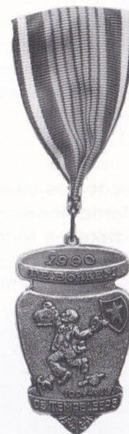
DE PRINSE-ORDE 1990 'DE BÖKKEM'