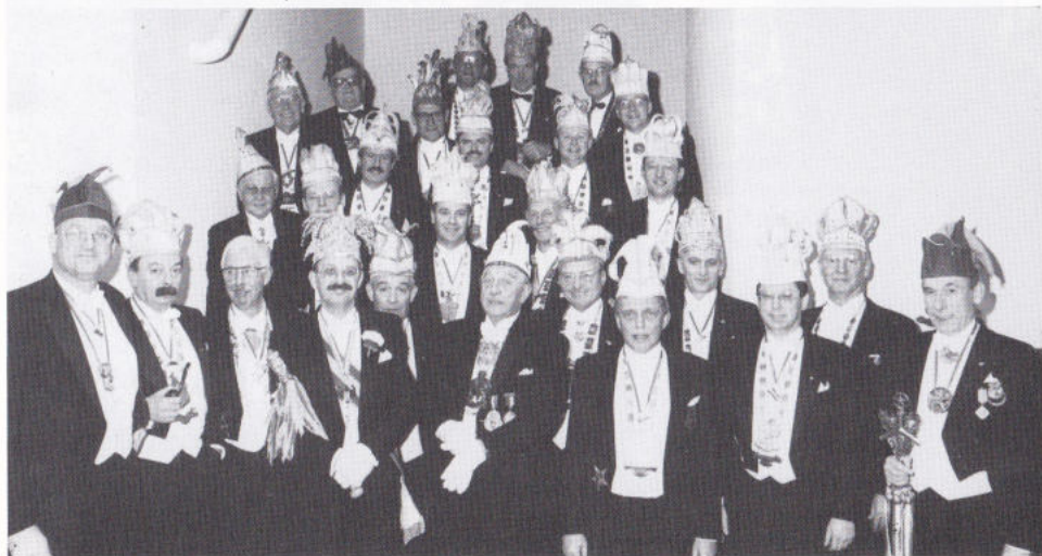
'T 'AAID ZËLLEVER' ...

'n Oplossing waor dao wel. 't MECC. D'r is gepraut, d'r is euverlag begrippe es tradisie, binnenstad, sjieke zaol woorte vaan alle kante bekeke. Zellefs kraoge de Tempeleers mie es ins 't verwiet tot ze allein mer op de sent oet waore.