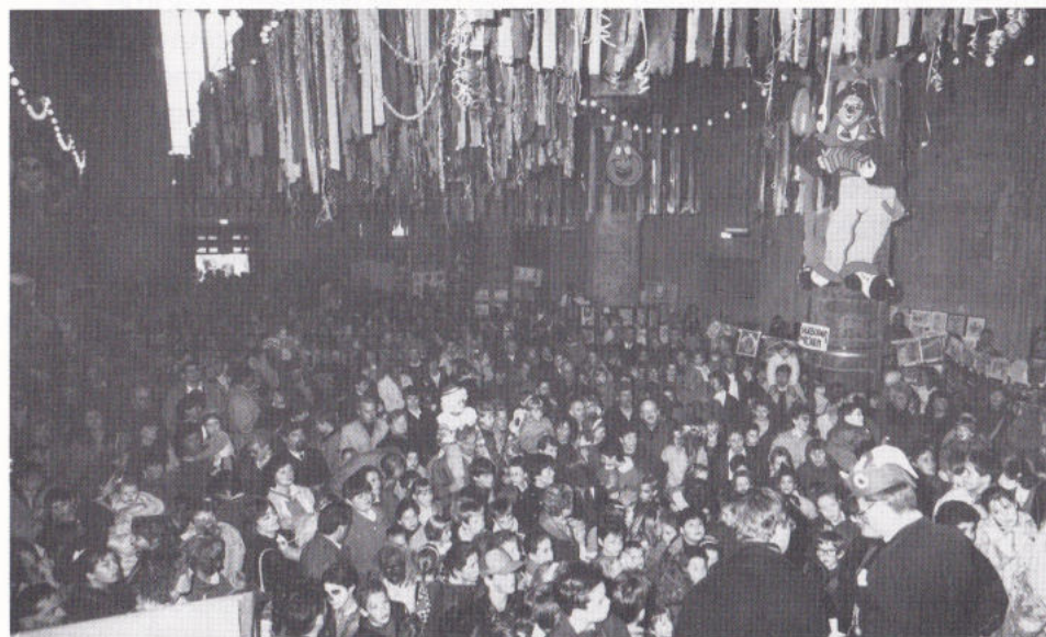
'T ZJUBILEI WOORT MASSAAL GEVIERT.