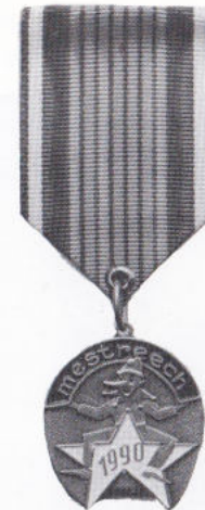
'T KLOJNSKE 1990 DE KINDERMEDAALJE