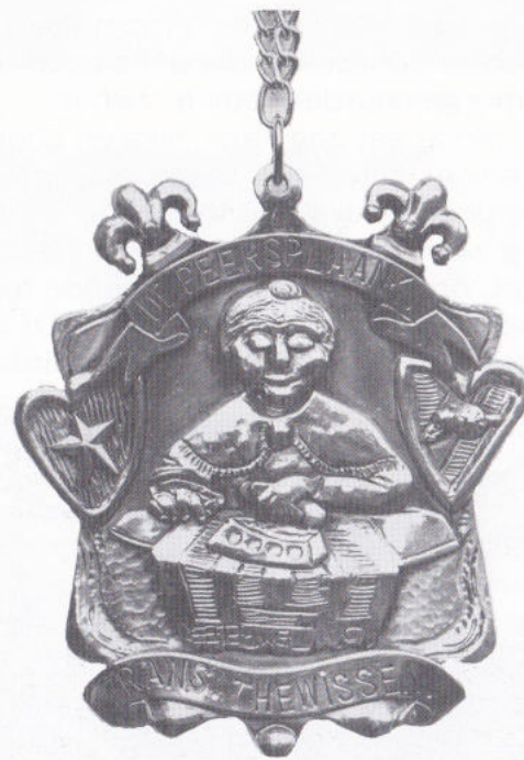
DE HOMMAGE AON TEMPELEER FRANS THEWISSEN 'DE PEERSPLAANK'.