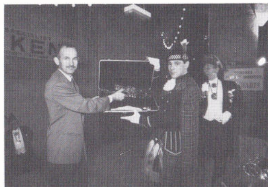
DE RABOBAANK ZÖRREG VEUR NUIJ KOPER BEIJ DE KACHELPIEPERS.