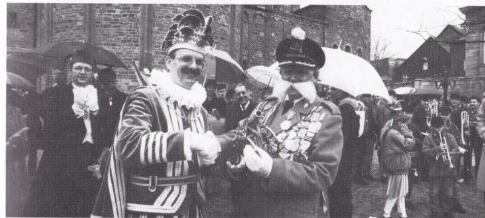
VEURIG JAOR NOG SJOFFEUR EN ... VASTELAOVESVIERDER.

De prins met gevolg oet Hasselt ginge met wie eeder jaor. Sozawe, oftewel d'n deens veur Sociaal Zakes aon de Zapstraot ging mèt, die zich leeveranseers vaan de groeten oonbekinde numde (esof dee neet al lang bei gans Mestreech bekind waor, me 'ne knien dee dao op let) en d'n optoch indigde met de