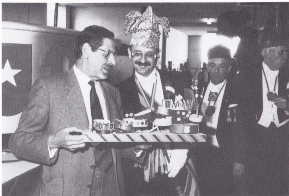
... MÖRREGE MÈT DE WAGEL VAAN DE ENCI.

heer welkom geheite door de baas vaan dees werrekplaots en toen vertrok d'n trein nao de staasie vaan Mestreech-centraal, boe 't gezelsjap ouch weer welkom geheite weurd, noe door de chef vaan de stasie. En op al dees plaotse heet natuurlik de sirremonie-protocollair plaots. Daan weurd in 'ne groete kortège nao de Merret gegaange. Wie ziech dat huurt, zit de prins in de prachtige Oldtimer vaan Harie Cuypers, geflankeerd door prizzedent en opper vaan De Tempeleers. Op de Merret weurd 't Mooswief geïerd es de patroenes vaan de Mestrecht Vastelaovend. Daonao is de Prins met zien Tempeleers op vesiet bei de bõrregemeister in 't stadhoes.