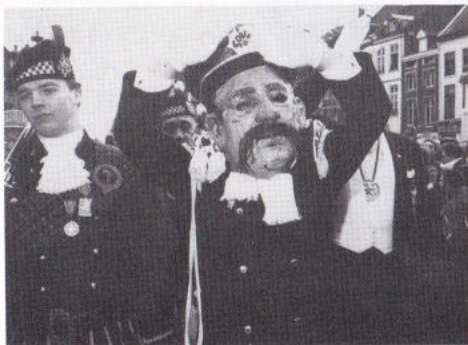
DE GROETEN ONBEKINDE ...