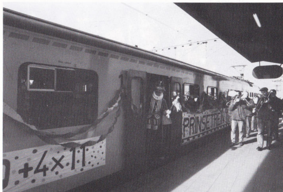
VENDAOG MÈT D'N TREIN VAAN DE NS ...

Zoe ouch op 24 fibberwaarie. Tege keteer nao twellef in de middag kaom de prins aon op de N.S.-lijnwerrekplaots. Dao woord