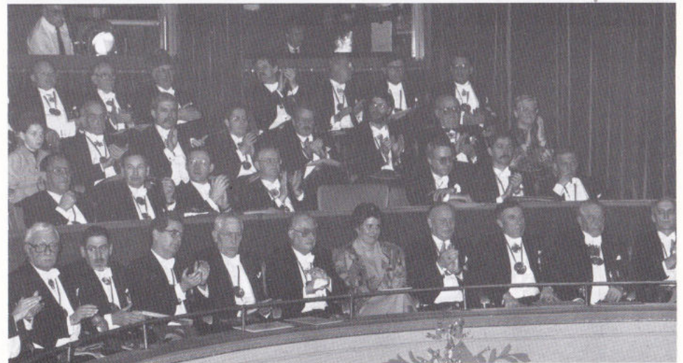
PRINSES MÈT 'T KOLLEGE VAAN TEMPELEERS IN DE LOGE.