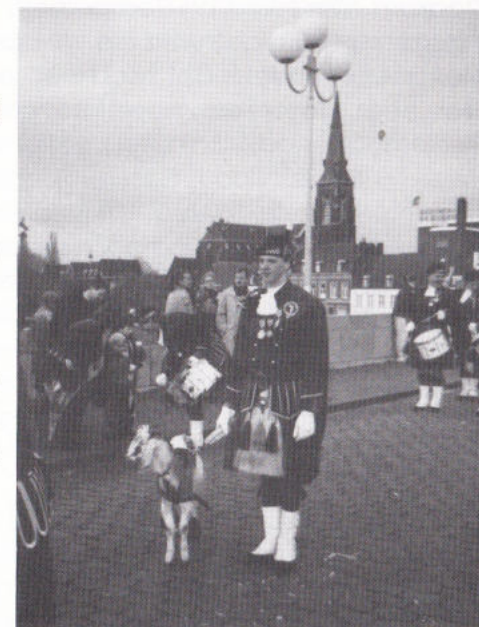
WÈT NOG IEMES 'NNE BOK TE LIENE VEUR 'T VOLLEGENDE SEZOEN?