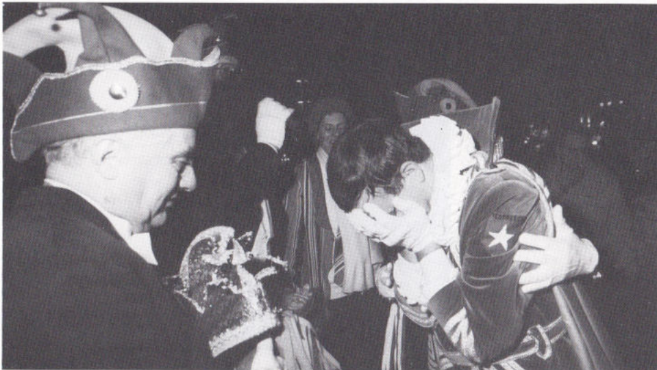
... EN DAT MOMINT PAK EEDEREIN ... OUCH HÄÖM.

De Prins z'n möts geit aof... ze sjabbeleer... z'ne scepter. Dat pakt 'm... Ouch heer heet traone... Gelökkeg dat dat nog kin... Daan... weg... Heer heet amper tied zich aof te vraoge wat gebäört... Wigel in. Veur de leste kier... Veurbij, veurgood.