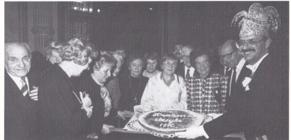
DE TEMPELEERSVLAOI VEUR DE 'IEWIGE STUDENTE'.

Later op d'n aovend woord ouch 't Tempeleersvlaojke oetgereik. Dit kaarraad woord gesjoonke aon 'De leuwige Studente'!