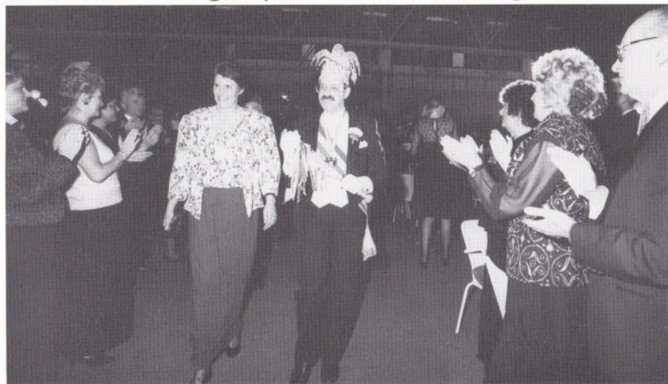
... OPENDE DE REI VEUR US 'BRILJANT' PRINSEPAAR.

Netuurlik waor de heur hoeger, netuurlik moos mie verseed weurde, netuurlik moos op miejer zaake gelet weurde, meh daan begôs toch op de bewusten aovend de bal op de meneer wie dat vreuger waor, versterrek door 't optreije vaan 't Garderizzemint De Kachelpiepers. Op zaoterdag 3 fibberwarie had 't groet festijn plaots. 't Aontal oetgereikte kaarte waor verdobbeld in vergelieking met 't veureg jaor. 't Aontal zitsjes waor vööl groeter es vreuger. De verseering waor aon de magere kant en d'r waor nog mie zaake die veur verbetering vatbaar waore, meh toch: de lui hadde miejer ruimte boedoor de sfeer toch get oongedwongener waor en ederein nao 'ne zier geslaagden aovend kontènt naor hoes gong. De gesignaleerde probleme zien op te losse en veur 't vollegend jaor is 't MECC weer aofgeheurd.