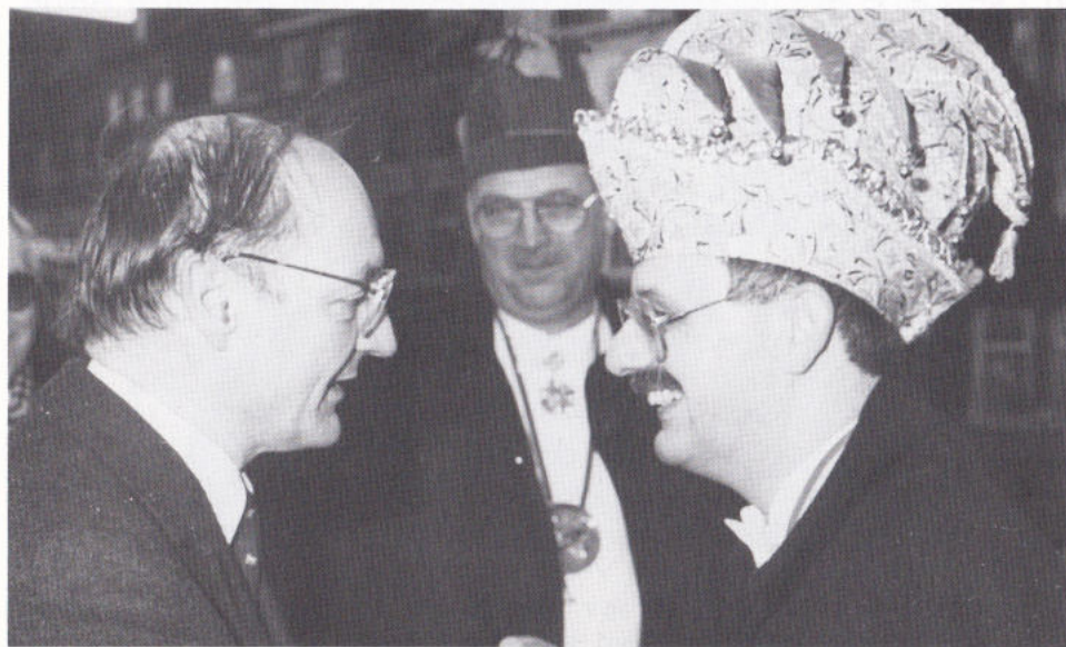
ZIENE HOEGSTE BAAS WINS HÄÖM VÄÖL SUKSES IN DE KOMENDE DAOG.