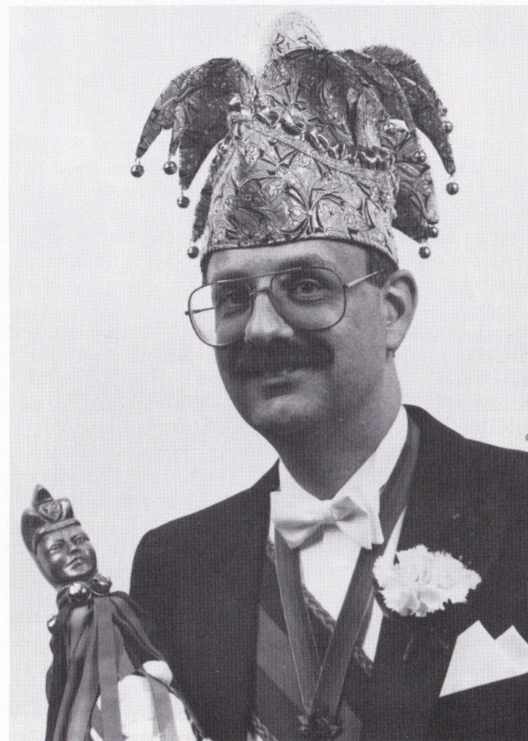
DE 'STAASIEFOTO' VAAN UZZE PRINS NICO I.