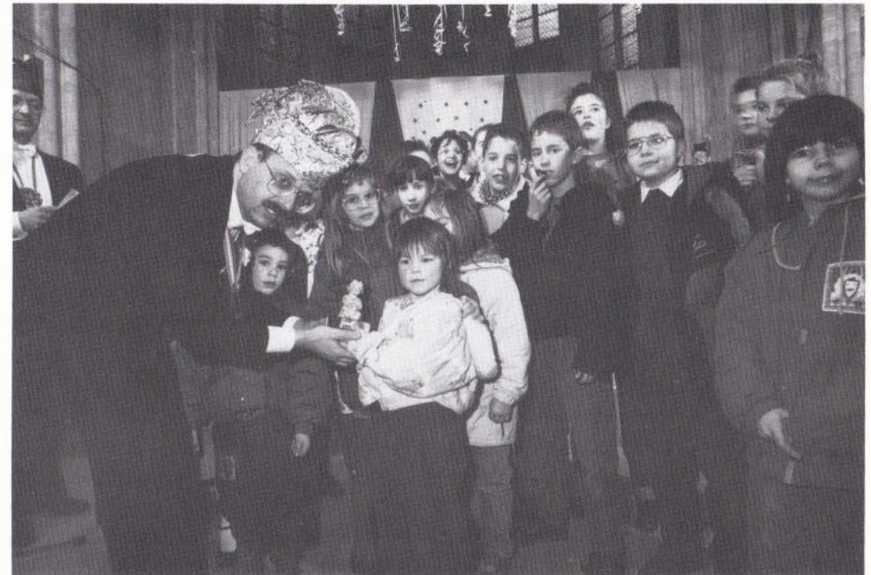
KINDERTEIKENWEDSTRIJD 1990 MÈT: NIKKELAKÖPKE; DE HAOLKAN, 'T BATTERÄÖFKE, 'T SJAARPÖTSJE, ENZ.