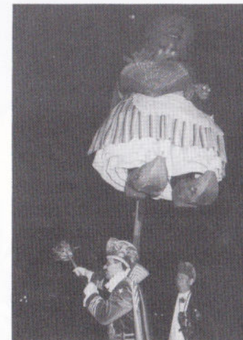
DINSDAGAOVEND 24.00 OOR. 'T MOESWIEF KUMP NAO OONDER ...