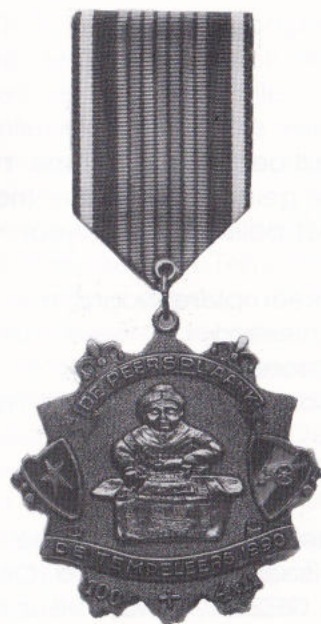
DE TEMPELEERSMEDAALJE 1990 'DE PEERSPLANK'

Wijer woorte nog 743 kindermedaaljele (Klojnke's) oetgereik.