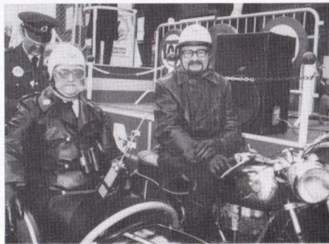
... WEURT OONDER PELIESIE-ESKORTE ...