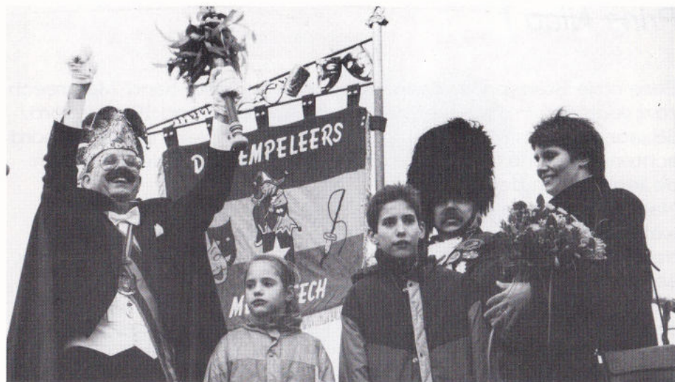
... OETEINDELIK BEKIND GEMAAK OPPE MERRET.