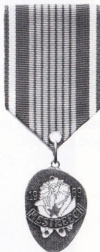
Kinder medaajil 1989