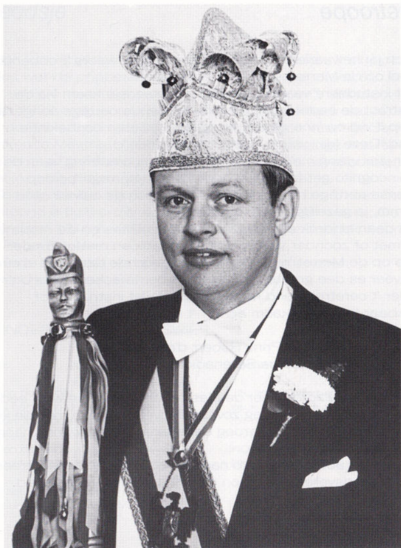
ZIENEN HOEGEN HOEGLÖSTIGHEID PRINS ROBERT D'N IERSTE