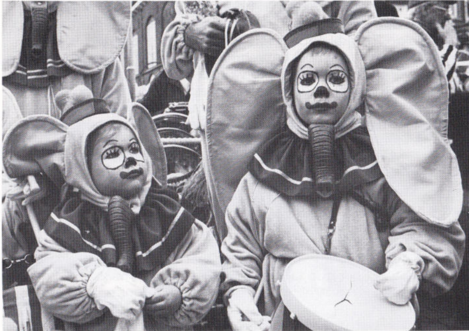
JOONK GELIERD ...