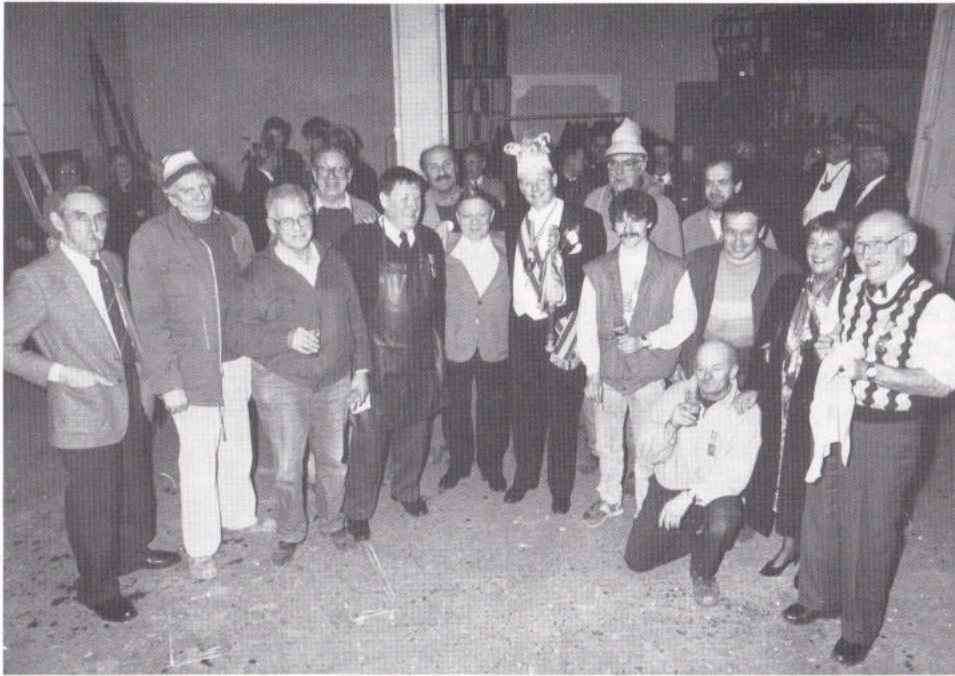
ZOONDER HUN GEINEN OPTOCH ...